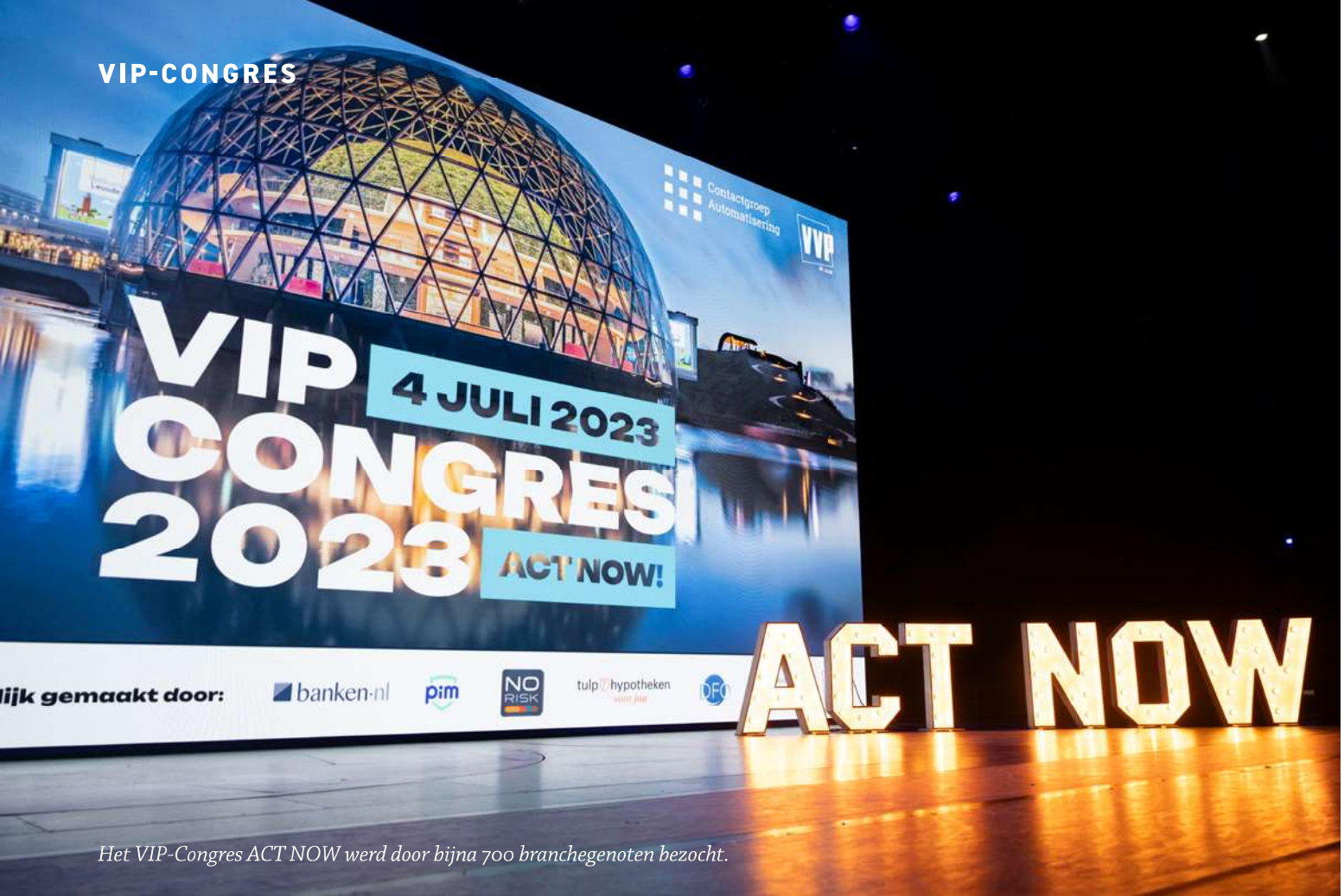
Het VIP-Congres ACT NOW werd door bijna 700 branchegenoten bezocht.